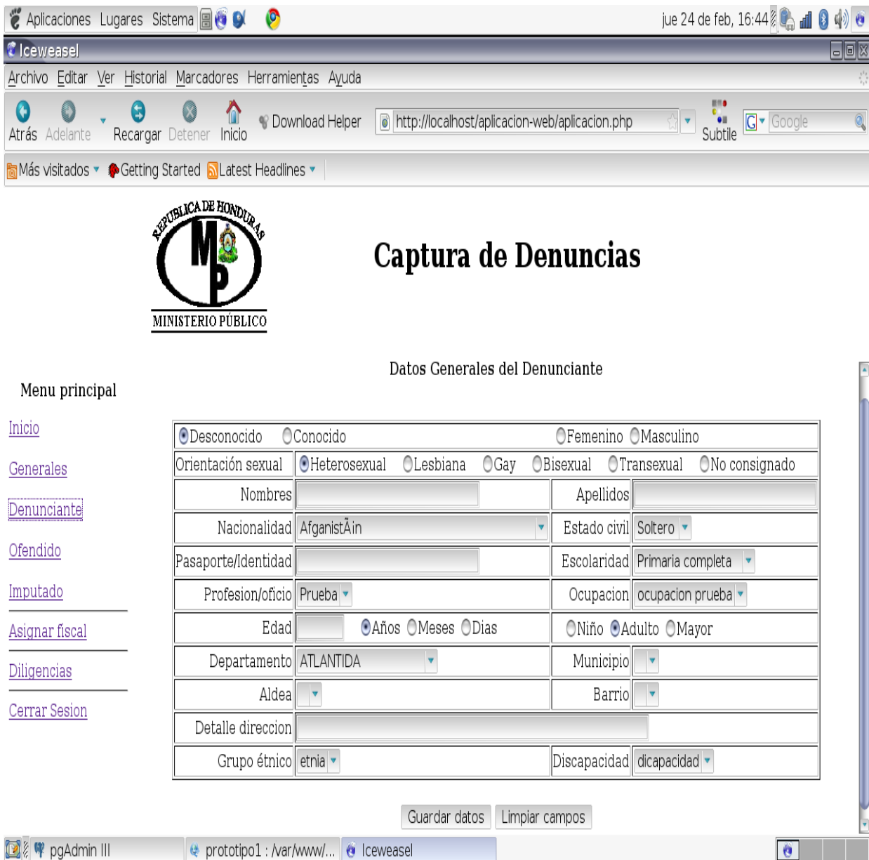
Gráfico 2. Captura de denuncias según preferencia sexual

En el programa para captura las denuncias del Ministerio Público, se ha introducido en la sección de datos generales del denunciante, la casilla de “orientación sexual”. Este esfuerzo es considerado como un gran paso en el reconocimiento de los derechos de la diversidad sexual.